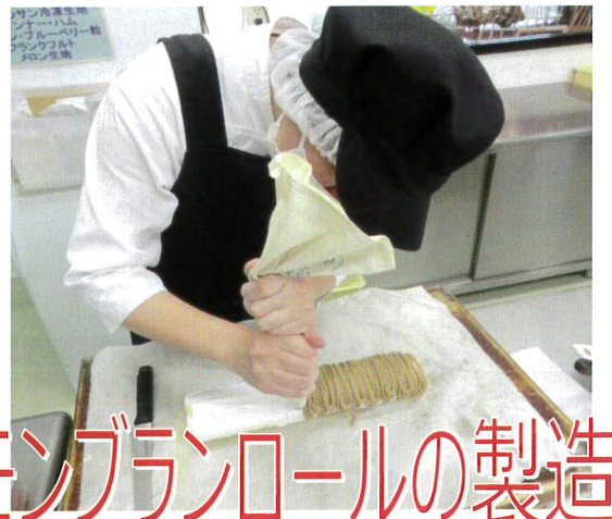
モンブランロールの製造

マロンペーストを巻き込んだマロン食パン、じっくり煮込んだアップルパイ、ふわふわシフォンケーキ、しっとりコクのあるブランデーケーキなど、様々なお菓子を手掛けています。写真はモンブランロールを仕上げているところです。パン工房ではパンをはじめとして、いろいろなお菓子作りにも挑戦しています。