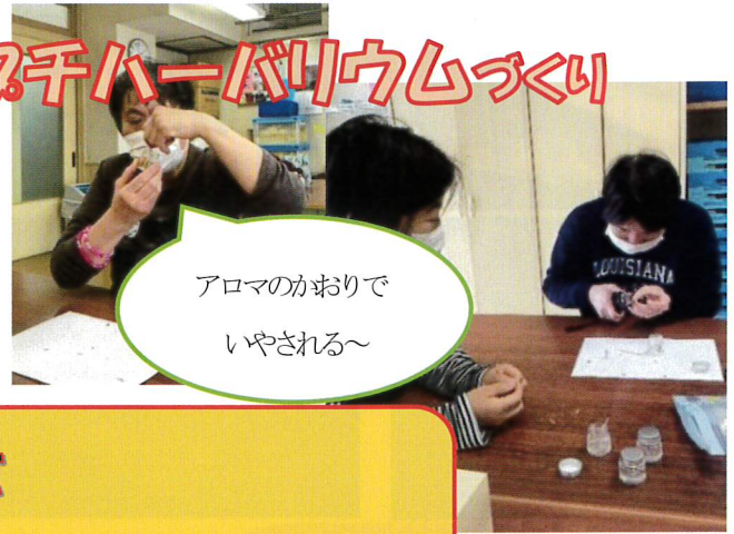
フキハーバリウムづくり