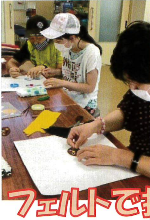
フェルトで指人形づくり

でも、利用者様が少しでも楽しめるように、コロナ感染予防対策を行いたんぽぽの部屋を借りて、プチイベントを行っています。楽しいよ〜♡♡