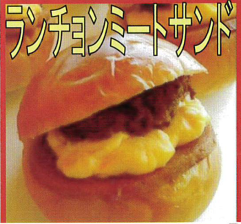
スパイシーなランチョン ミートと、甘辛いポーク ミートソースが絶妙！