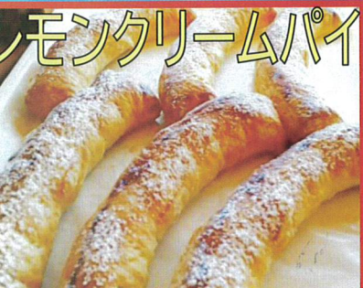
爽やかなレモンクリーム たっぷり！