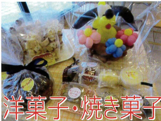
洋菓子・焼き菓子